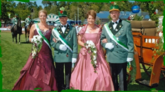
Idee und Gestaltung HAns-J. Frantzke / Michael Menke