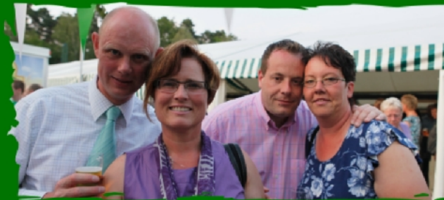
Gemeinsame Feier im SBH