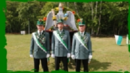
Vogelschiessen: gleich mit zwei Bewerbern der Klausheider Komp.

Transparenter Bereich kann beschnitten werden