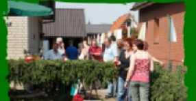
Kränzen beim Kaiser mit tatkräftiger Unterstützung der Dorfkompanie