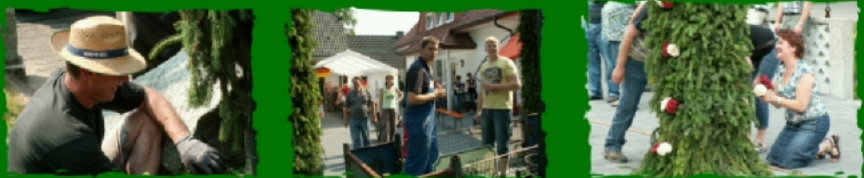
Auch bei den Prinzen haben wir tatkräftige Unterstützung von den anderen Kompanien erhalten.