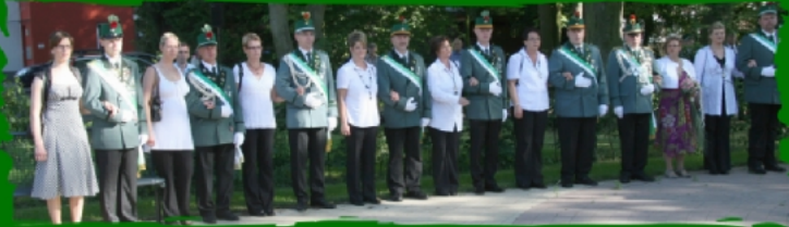
Samstag im Pfarrgarten