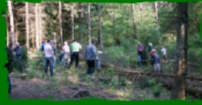
für Kaiser und Prinzen