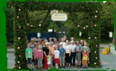
Kränzen bei den Prinzen