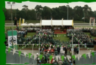
Bundesfest in Vechta